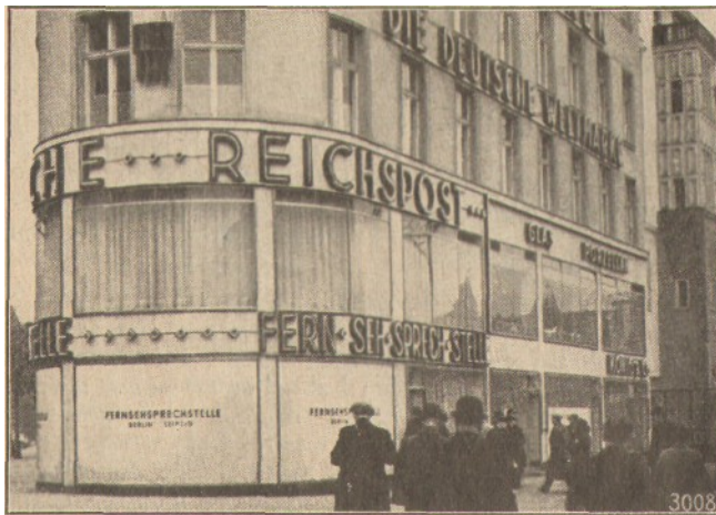
Abb. 1. Die Fernseh-Sprechstelle der Deutschen Reichspost in Berlin-Charlottenburg

Betritt man eine der Fernseh-Sprechzellen, so wird man freundlich aufgefordert, auf einem Sessel Platz zu nehmen; so erreicht man, daß der Kopf in eine bequeme Höhe kommt. Vor sich sieht man eine rechteckige, dunkle Öffnung, auf der auch schon das Brustbild des lieben Kollegen erscheint, mit dem man sich unterhalten will. Er hat das Messeabzeichen angesteckt, und er hält das Meßadreßbuch hoch, während er uns erzählt, wie tüchtig er auf der Leipziger Messe gearbeitet hat. Wir glauben ihm das gern, denn er sieht wirklich sehr müde aus; der Messebetrieb scheint dort tief in die Nacht hineinzugehen . . .